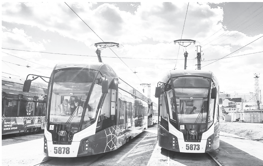
С конца прошлого года «Львята» питерского производства успешно эксплуатируются на улицах нашего соседа по Приволжскому федеральному округу - Перми.

«Мы уже начали производство, сроки выполнения контракта достаточно сжатые, но нам не привыкать работать в таком режиме, - комментирует пре-